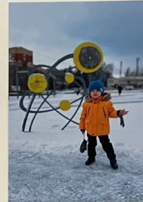
Все планеты дружно в ряд Выходите на парад.