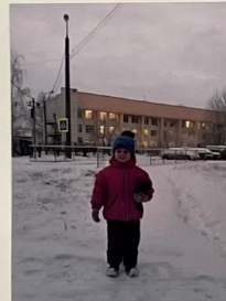
Очень быстро подрасту В школу скоро я пойду Буду там читать, писать И пятерки получать!