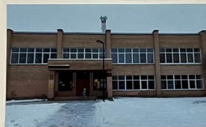
Дом для книг построили Стеллажи устроили. Будем книги мы читать Все науки познавать.