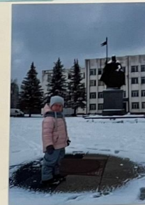
Славный воин Пересвет Подвигу его забвенья нет.