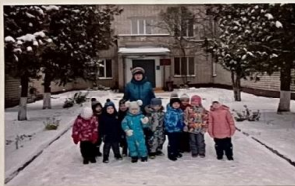
Наш любимый детский сад Каждый видеть очень рад. Здесь играем и поем Очень дружно мы живем.