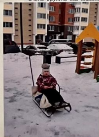
Дом наш новый и красивый Целых десять этажей, А площадка - загляденье Для самых маленьких детей.