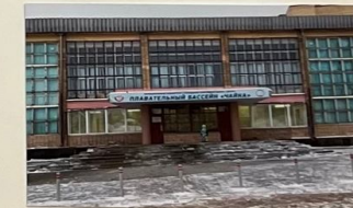
Плаваем, ныряем В бассейне мы всегда. И, конечно, занимаем Первые места!