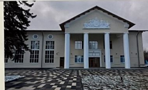
Дом Культуры нас зовет Приходи скорей народ! Праздник, сказка, представление Всем гостям на удивленье!