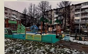
Карусели и качели Брусья, лесенка, стена Это новая площадка Очень деткам всем нужна.