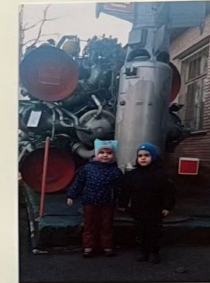
Изучаем мы ракеты. Чтобы посетить планеты.