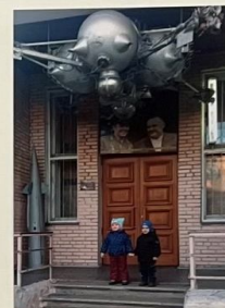
Космонавтом стать хочу В космос точно палец. А пока я подрасту Звездную науку изучу.