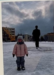
А из нашего окна Площадь Пухова видна!