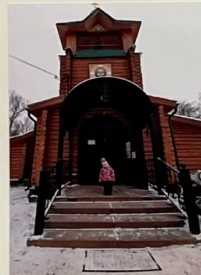
Бом - бом, бом - бом Слышен колокольный звон. Собирайся народ Всех на службу Храм зовет.