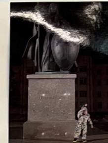
Буду спортом заниматься Чтоб, как воин Пересвет Смог страну свою родную Защитить от врагов и бед.