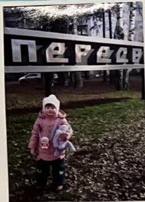
Славный город Пересвет И тебя роднее нет. Ты зеленый и красивый Жителями любимый!